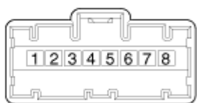
[自动灯光传感器连接器]